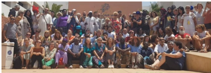
Photo de groupe à la RIDEF Maroc. La prochaine aura lieu au Mexique en 2024