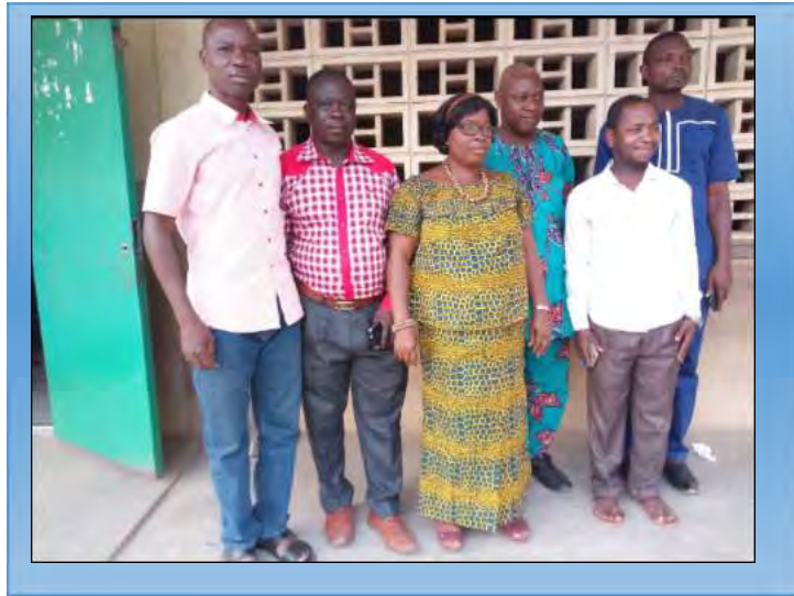
La délégation togolaise au FEFB

des ONG Aides et Actions Internationales basée à Kara qui essayait de soutenir un peu le mouvement pour des formations. Après, les quelques têtes qui ont commencé par prendre un peu ont été regroupés pour un stage de personnes ressources. Ceux-là ont un plus en formation qui leur permettait de commencer par former les autres. Quand il y a sensibilisation, on les appelle et ils viennent pour témoigner. C'est comme ça que nous avons évolué jusqu'à ce que des gens sont identifiés comme formateurs potentiels.