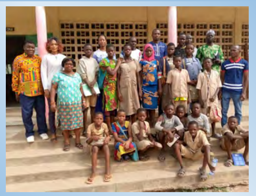
Les forumiens inscrits pour cet atelier en activité puis en photo de famille avec les apprenants