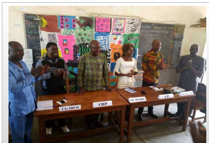
Photo d'ensemble à la cérémonie d'ouverture du Forum de

Dans le souci d'échanger sur les techniques de la pédagogie Freinet, la première édition du Forum des Éducateurs Freinet du Bénin a organisé une rencontre où les Éducateurs de la pédagogie Freinet venus des différentes régions du Bénin, des pays frères du Burkina Faso et du Togo ont répondu présent à cette communion.