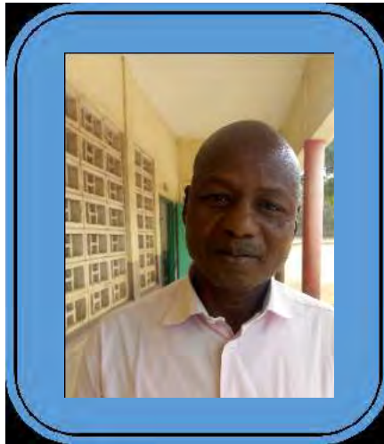
Tiburce SAWADOGO, représentant du Burkina-Faso au Forum de

Le burkinabè Tiburce SAWADOGO, ambassadeur du Burkina-Faso à ce forum, croit que les mouvements béninois et togolais sont à féliciter et doivent s'estimer heureux parce que constituant des modèles pour le Mouvement Burkinabè de l'Ecole Moderne (MBEM), en matière d'expérience, qui a vu le jour en 2002 et qui compte aujourd'hui trois antennes qui dans le temps fonctionnaient de façon autonome.