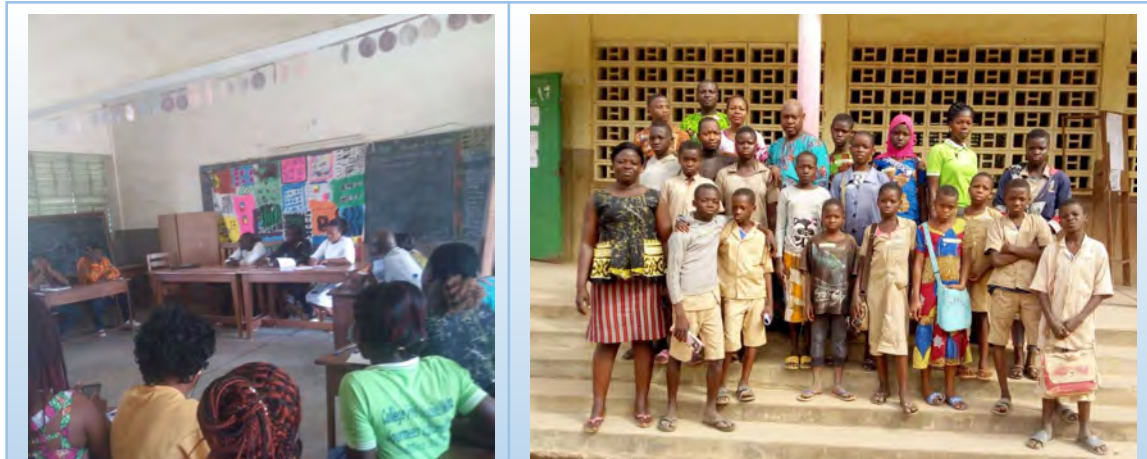
Photo de famille avec les apprenants présents ayant animés l'atelier de l'organisation

Notons que pour la phase de systématisation, il faut laisser les apprenants de nos classes s'essayer. Cela les forges le plus.