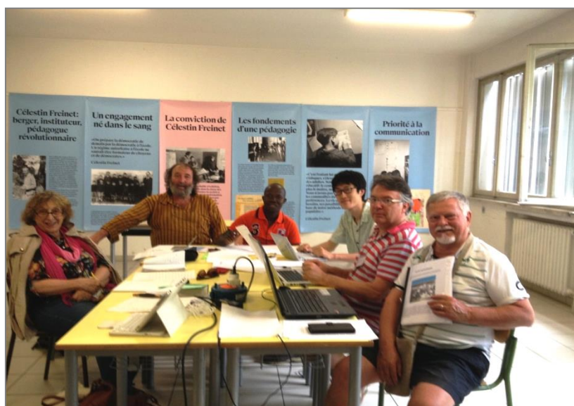
Groupe de travail sur le film "école buissonnière" à la RIDEF Italie 2014 Photo Brou (P12)

MAINTIEN DE LA JEUNE FILLE A L'ECOLE : CAS DES ECOLIERES DE CM2 DE FAIBLE NIVEAU