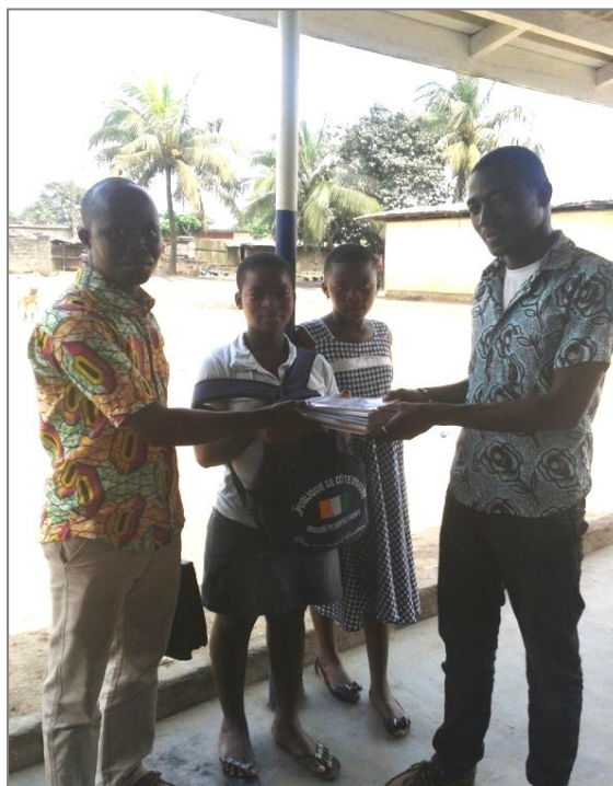
Remise de kits scolaire du MESAD à N'Tobeni Photo2 Brou