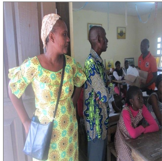
Mme. Mabé et le Directeur de l'EPP Nord 1 suivent la séance de travail des "filles-espoir" et la télévision italienne (P14)