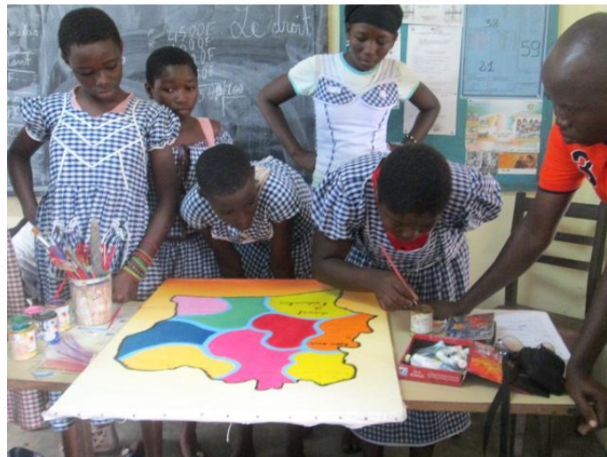
LES ŒUVRES DES "FILLES-ESPOIR DU MILLENAIRE"