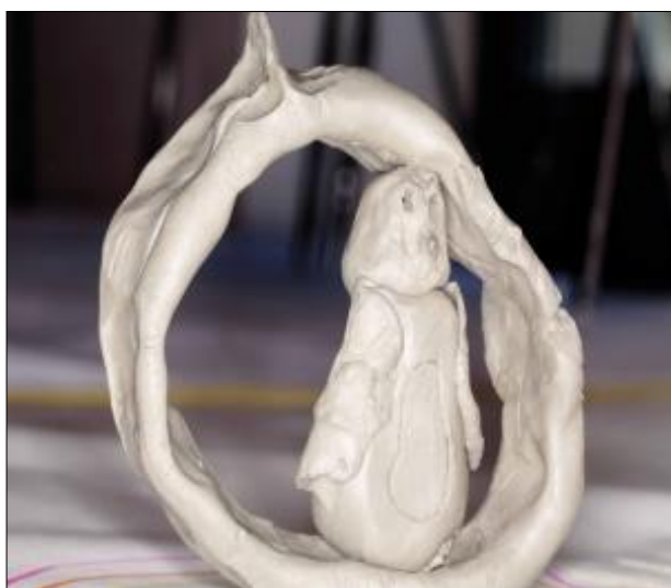
dal laboratorio di ceramica dei bambini della Ridef